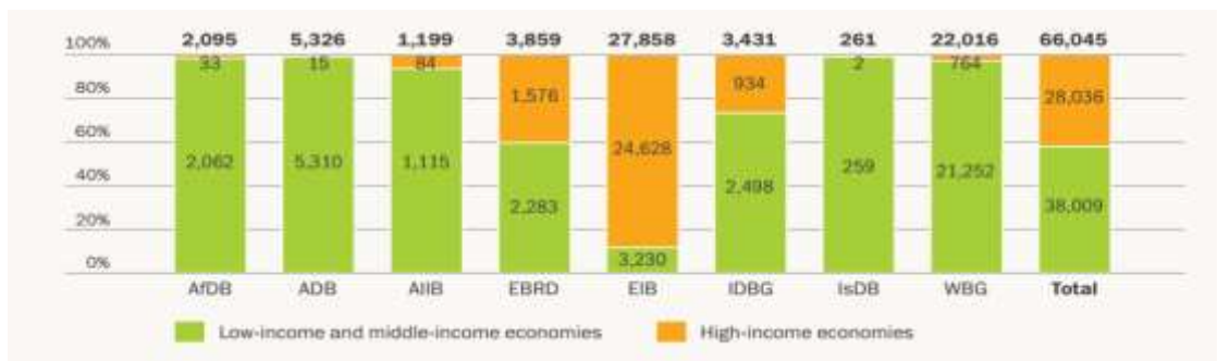
Gráfico No.2 Compromisos de financiamiento climático 2010-2020 en millones de USD.